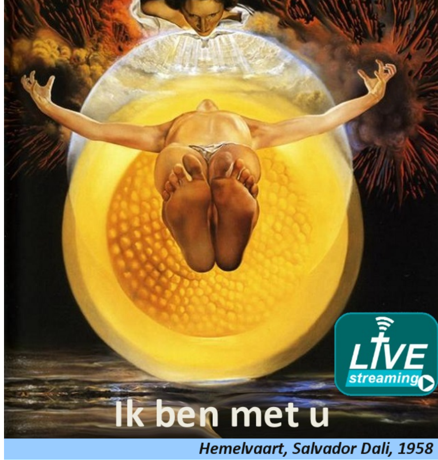
Hemelvaart, Salvador Dali, 1958

Geachte {{aanhef}} {{volledigeachternaam}}, Naar aanleiding van verzoeken om sneller op de hoogte gebracht te worden van actuele zaken, sturen wij u het volgende bericht.