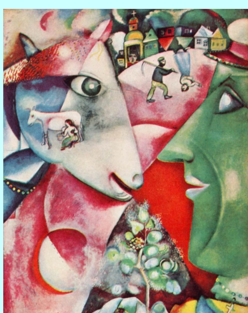
"Ik en mijn dorp" (1912); Marc Chagall (1887 – 1985)

Nog niet zo lang geleden werden in een Tv-programma Nederlandse immigranten, die 70 jaar geleden naar een ander werelddeel vertrokken, geïnterviewd. Stuk voor stuk vertelden ze over die moeilijke beginjaren in hun nieuwe vaderland. Ze vertelden over hun gevoelens van gemis; over de onbereikbaarheid van hun geliefden en vrienden in Nederland. Maar ze vertelden ook dat ze er – vaak met vallen en opstaan – uiteindelijk in slaagden hun gevoelens van leegte en gemis los te laten én om te zetten in herwonnen levenskracht. Door zich vanaf dat moment nog steviger te wortelen in hun nieuwe vaderland ontstonden voor hen nieuwe en onverwachte perspectieven.